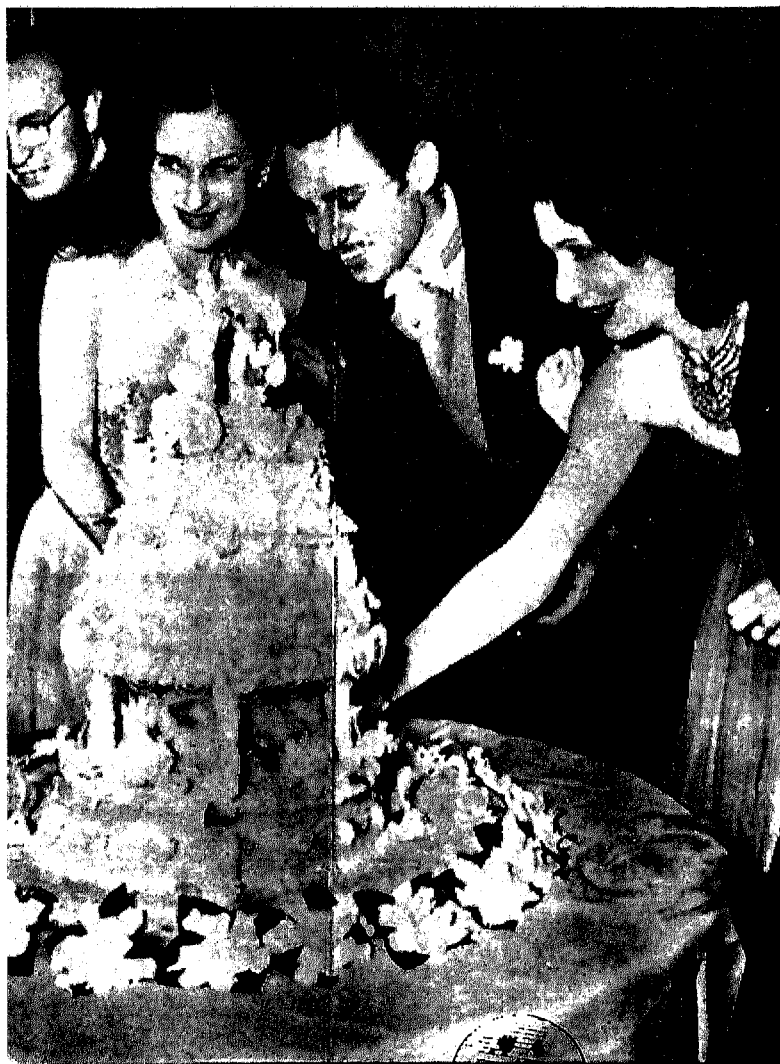
الملكة نازلي تحتفل بعيد زواج ابنتها الأميرة فتحية . . وبجوارها زوج ابنتها رياض بن راشد آل مكتوم الذي عقد زواجهما .